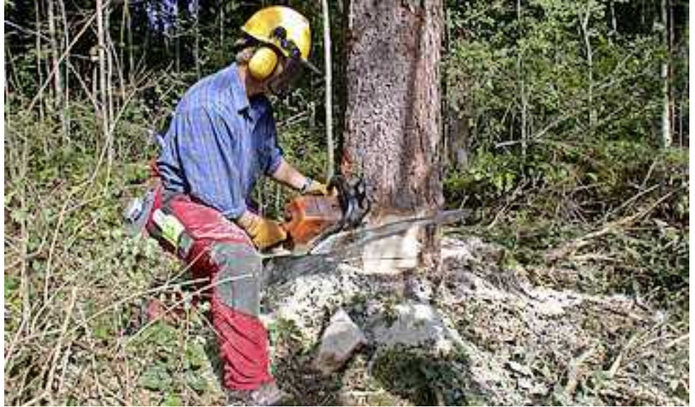
Informationen und Anmeldungen beim LFI, Tel. 05574/400-191 oder unter www.vbg.lfi.at !

In Forstkursen erlernen Hobbyholzer unter fachlicher Anleitung die richtige Wartung und Instandhaltung der Motorsäge. In Theorie und Praxis geht es um die Technik beim Fällen und das Aufarbeiten von Schwach- und Starkholz sowie um die Schutzausrüstung. Nach der Teilnahme an allen drei Modulen erhalten Sie den Vorarlberger Motorsägenführerschein.