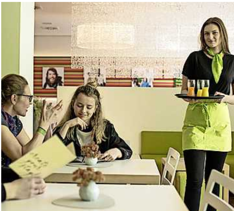
Alle Infos unter www.aha.or.at/

Von Sommerpostler bis Bonbonverkäufer: In der aha-Ferienjobbörse www.aha.or.at/ferienjob kann online nach freien Stellen gesucht werden. Öfters reinschauen lohnt sich, da die Ferien- und Nebenjobbörse laufend aktualisiert wird. Wer noch Jobs für den Sommer zu vergeben hat, kann diese dort kostenlos eintragen.