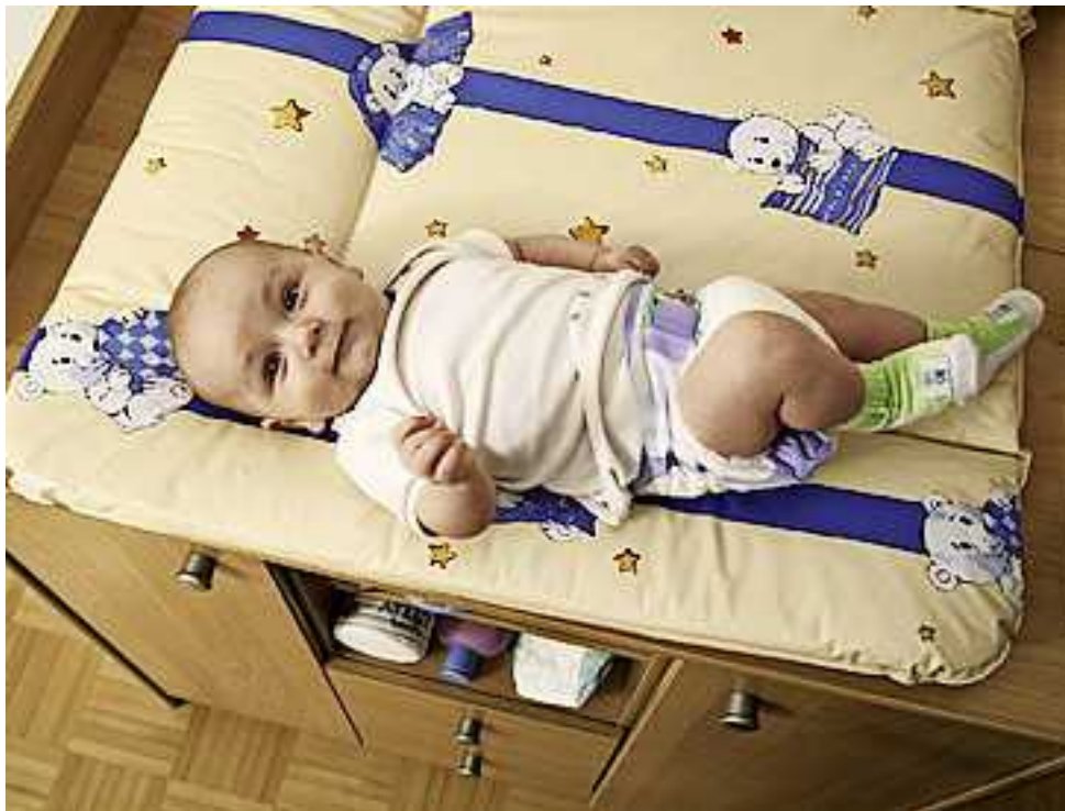
Weitere Infos unter www.sicheresvorarlberg.at !

Weitere Informationen und eine Checkliste zur Vorbeugung von Kinderunfällen finden Sie in der Broschüre „Kindgerecht. Ein Kinderspiel“. Diese kann unter Tel. 05572/54343 oder E-Mail info@sicheresvorarlberg.at bestellt werden.