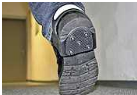
Weitere Infos unter www.sicheresvorarlberg.at !