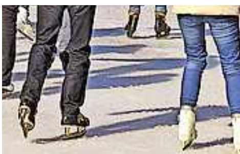
Weitere Infos unter www.sicheresvorarlberg.at !