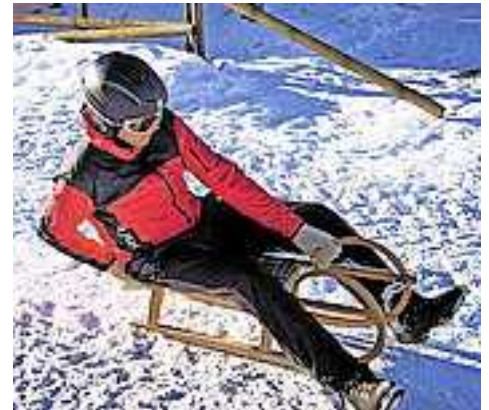
Weitere Infos unter www.sicheresvorarlberg.at !

dementsprechend gut auswählen. Wichtiger Bestandteil ist auch die Kleidung. Feste Schuhe mit einer guten Sohle sind zum Bremsen unerlässlich. Schibekleidung, Helm und Handschuhe sorgen für ein zusätzliches Sicherheitspolster. Kinder sollten nie alleine auf abschüssigen Hügeln rodeln, auch die Auslaufsituation ist zu beachten.